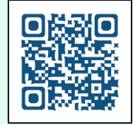
『排泄ケアナビ』はコチラ